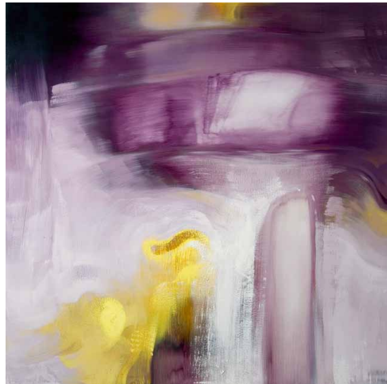
阿卜極 對白 油彩、畫布 ABUGY Dialogue Oli on canvas, 200 x 200 cm 2009