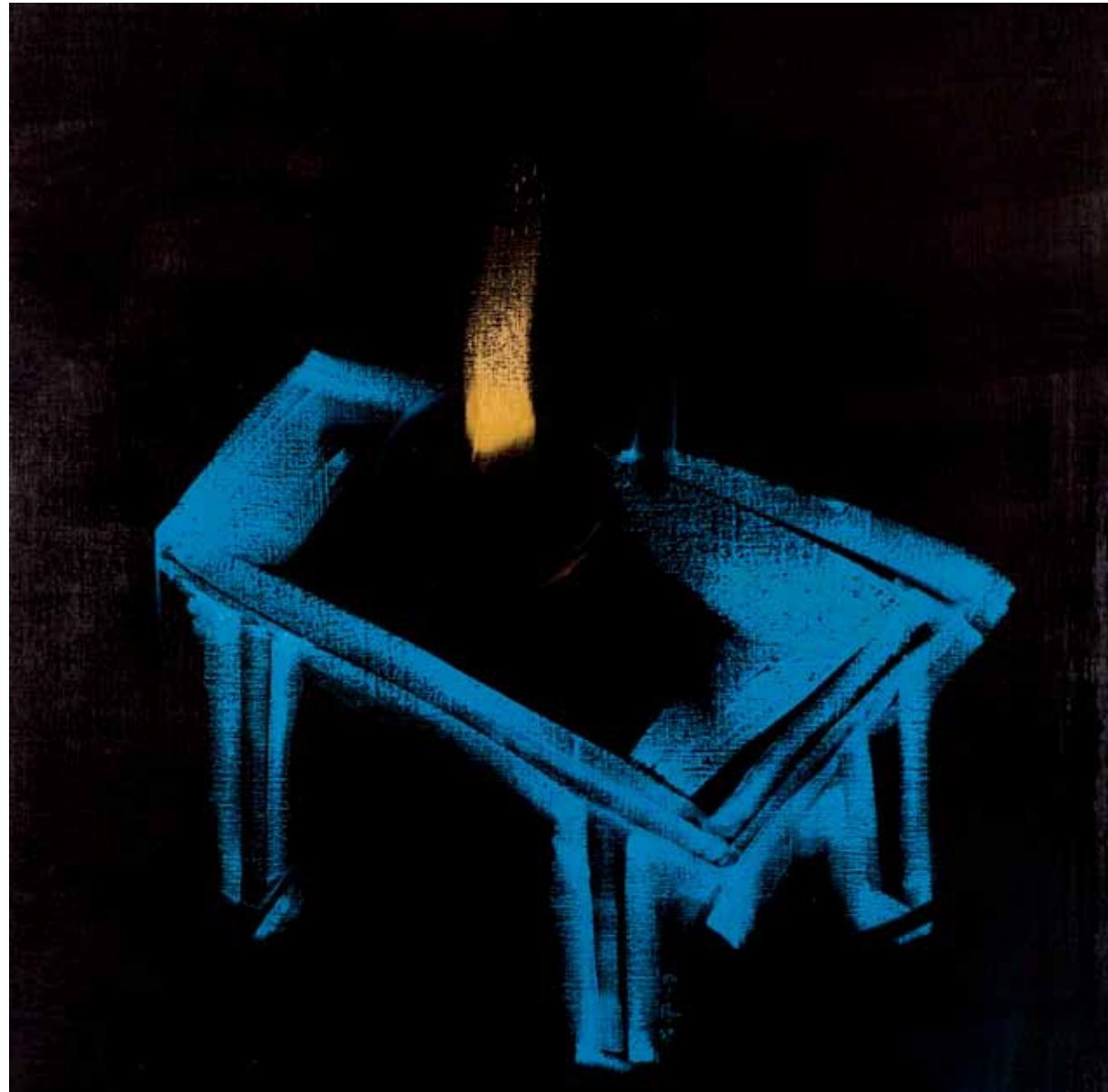
阿卜極 桌上 油彩、畫布 ABUGY On the Desk Oil on canvas, 100 x 100 cm 2009