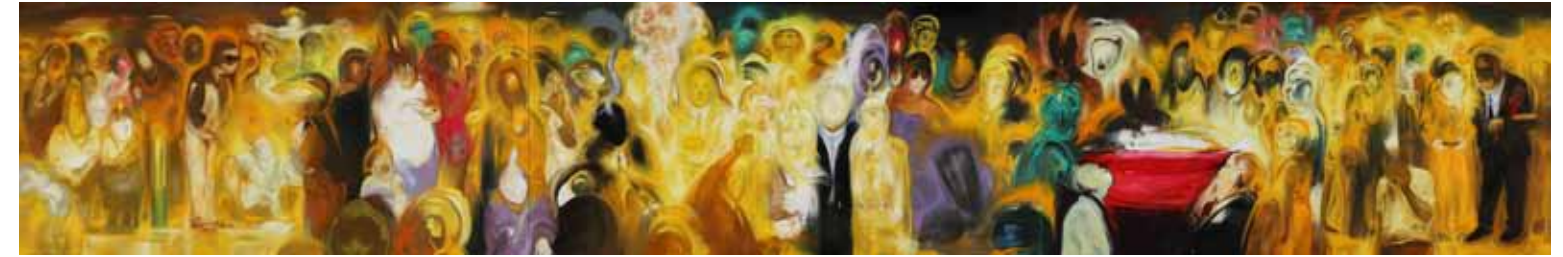
阿卜極 活樣 油彩、畫布 ABUGY Life Appearance Oli on canvas, 198 x 1200 cm 2009