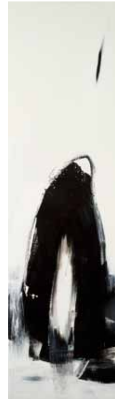
阿卜極 漂浮的零——石頭的事 壓克力、畫布 ABUGY Floating Zero: Stone Stuff Acrylic on canvas 210 x 60 cm 2009