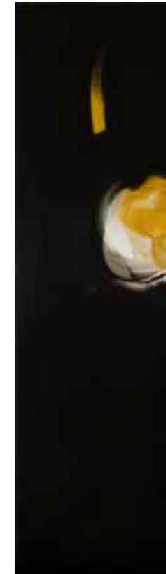
阿卜極 漂浮的零——一個覺 壓克力、畫布 ABUGY Floating Zero: Awareness Acrylic on canvas 210 x 60 cm 2009