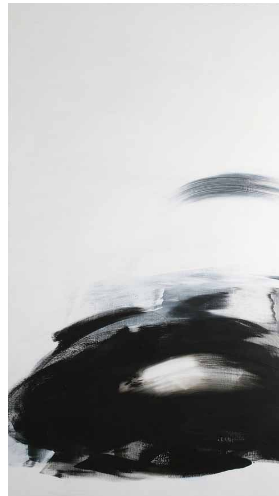
阿卜極 同在 油彩、畫布 ABUGY Simultaneous Oli on canvas , 200 x 120 cm 2004

A moment, known, unknown, the existing vitality Reading lives, activating energies for exploration and perception observing the vitality of every living thing and the possibility for interaction