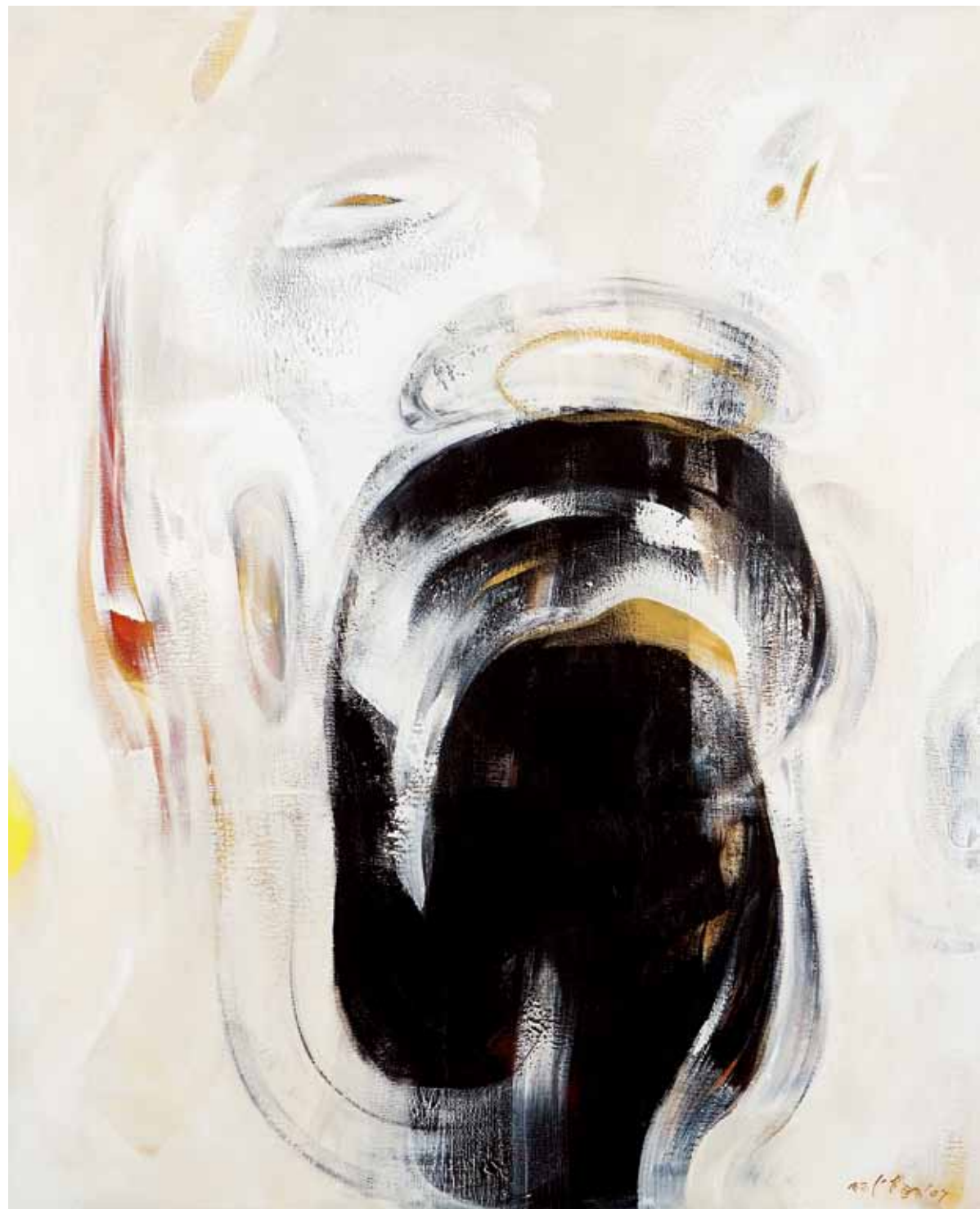
阿卜極 鏡中意識 壓克力、畫布 ABUGY Mirror Consciousness Acrylic on canvas, 210 x 170 cm 2007