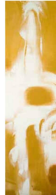
阿卜極 漂浮的零——陣微光 壓克力、畫布 ABUGY Floating Zero: The Faint Light Acrylic on canvas 210 x 60 cm 2009