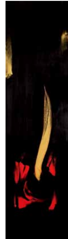
阿卜極 漂浮的零——鏡中弦 油彩、壓克力、畫布 ABUGY Floating Zero: Strings within Mirror Oil, acrylic on canvas 210 x 60 cm 2009