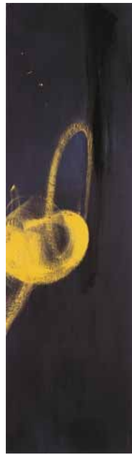
阿卜極 牛鼻上的零圈—牛鼻上 的一顆零圈 油彩、畫板 ABUGY The Ring on the Bull's Nose: Ring on the Bull's Nose Oil on board, 210 x 60 cm 2004