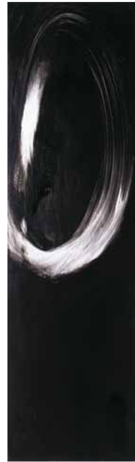
阿卜極 牛鼻上的零圈—零圈 壓克力、畫布 ABUGY The Ring on the Bull's Nose: Ring's Affairs Acrylic on canvas, 210 x 60 cm 2004