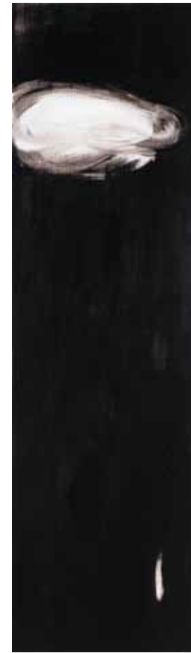
阿卜極 牛鼻上的零圈—雲的心 壓克力、畫板 ABUGY The Ring on the Bull's Nose: Heart of the Clouds Acrylic on board, 210 x 60 cm 2004