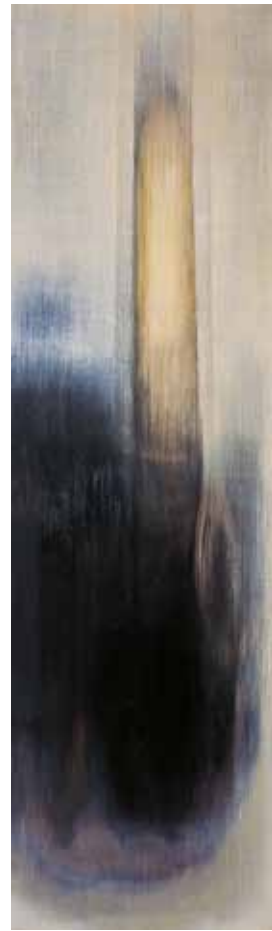
阿卜極 牛鼻上的零圈—象鼻高伸 油彩、畫板 ABUGY The Ring on the Bull's Nose: High Trunk Oil on board, 210 x 60 cm 2004