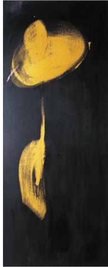
阿卜極 牛鼻上的零圈—就是 油彩、畫板 ABUGY The Ring on the Bull's Nose: It Is Oil on board, 210 x 80 cm 2004