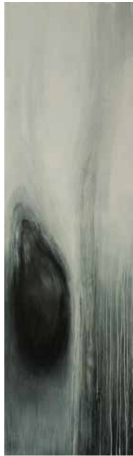
阿卜極 牛鼻上的零圈—黑圈的它 壓克力、畫板 ABUGY The Ring on the Bull's Nose: Black Ring Itself Acrylic on board, 210 x 60 cm 2004