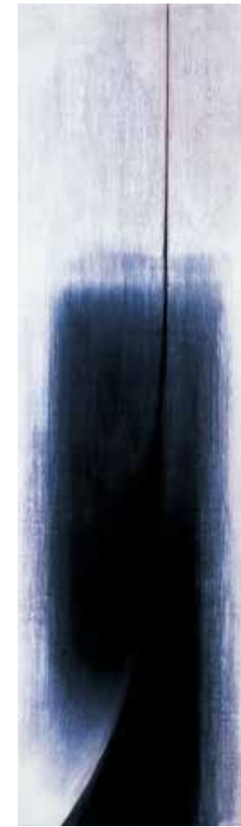
阿卜極 牛鼻上的零圈—大樹藏根 油彩、畫板 ABUGY The Ring on the Bull's Nose: Large Tree, Hidden Roots Oli on board, 210 x 60 cm 2004