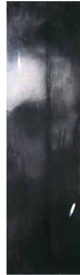
阿卜極 牛鼻上的零圈—醒來的魚 壓克力、畫板 ABUGY The Ring on the Bull's Nose: Awakened Fish Acrylic on board, 210 x 60 cm 2004